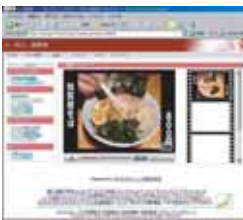
PC版:映像配信ページ