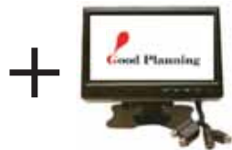
設置モニター連動