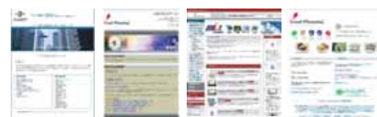
不動産・人材派遣・ネットショップ・食品・保険 etc...