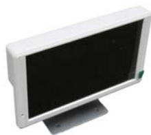
平置きで高さ調整可能