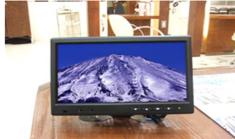
7インチワイドスクリーン液晶モニタ